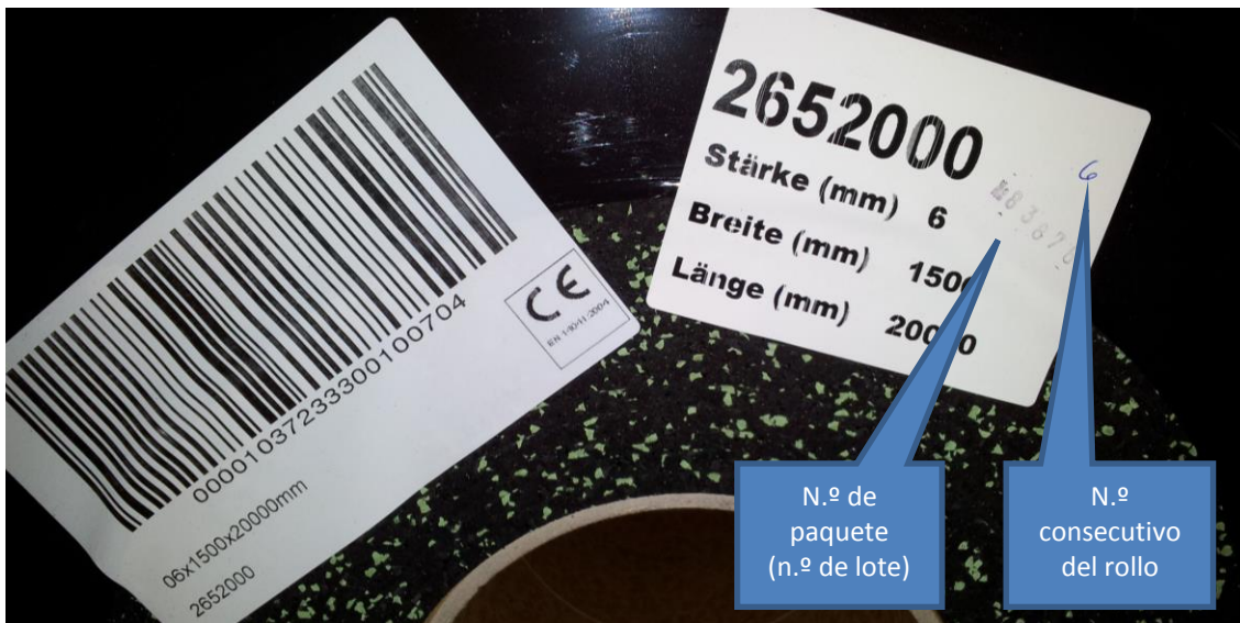
Figura 4: Rotulación de los rollos con el número de paquete y de rollo

Presente de inmediato su reclamación y detenga enseguida la instalación en caso de recibir producto erróneo o defectuoso, que la cantidad incorrecta o detecte otros posibles fallos. Solo es posible realizar la reclamación de materiales suministrados si estos no se han modificado y se indica el lote de producción (véase figura 4).