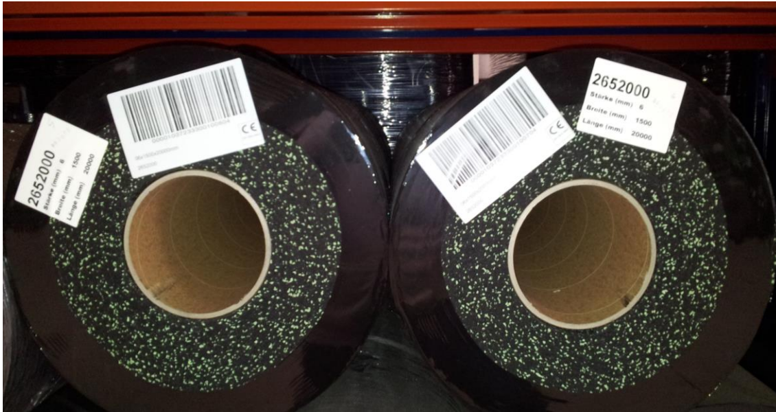
Figura 3: Durante la colocación observar especialmente el lote (ver etiquetas)