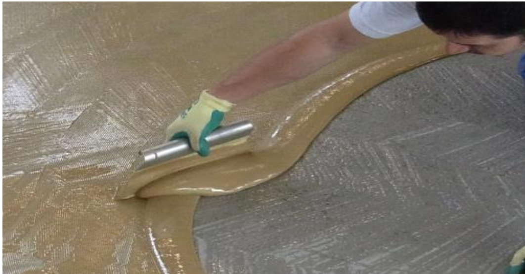
Figura 1: Aplicación de la cola sobre la base

En caso necesario, limpie y elimine cualquier tipo de suciedad del revestimiento antes de aplicar el sellado. No se puede pisar el revestimiento hasta que la capa de sellado se haya endurecido por completo.