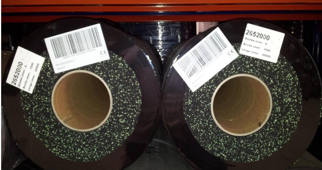
Figura 3: Durante la colocación observar especialmente el lote (ver etiquetas)