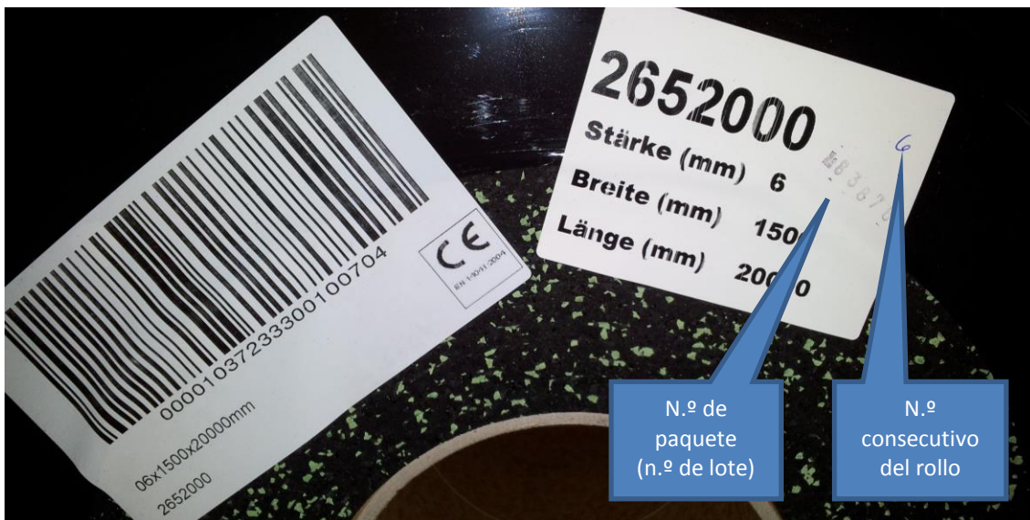
Figura 4: Rotulación de los rollos con el número de paquete y de rollo

Presente de inmediato su reclamación y detenga enseguida la instalación en caso de recibir producto erróneo o defectuoso, que la cantidad incorrecta o detecte otros posibles fallos. Solo es posible realizar la reclamación de materiales suministrados si estos no se han modificado y se indica el lote de producción (véase figura 4).