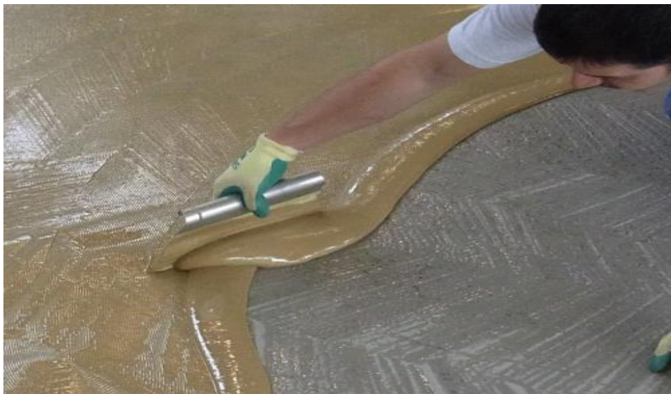
Figura 1: Aplicación de la cola sobre la base

En caso necesario, limpie y elimine cualquier tipo de suciedad del revestimiento antes de aplicar el sellado. No se puede pisar el revestimiento hasta que la capa de sellado se haya endurecido por completo.